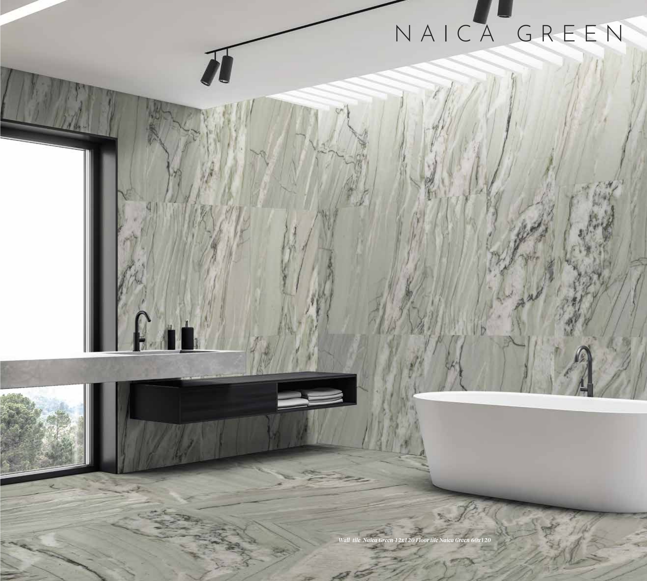
Wall tile Naica Green 12x120 Floor tile Naica Green 60x120